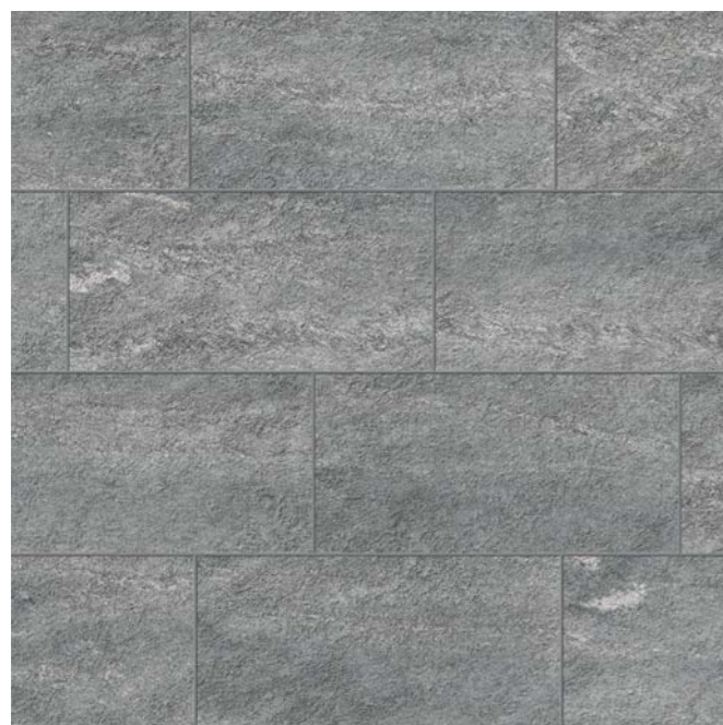
FORTH QUARZITE GRIGIA 22,5x45,3 .9"x18"