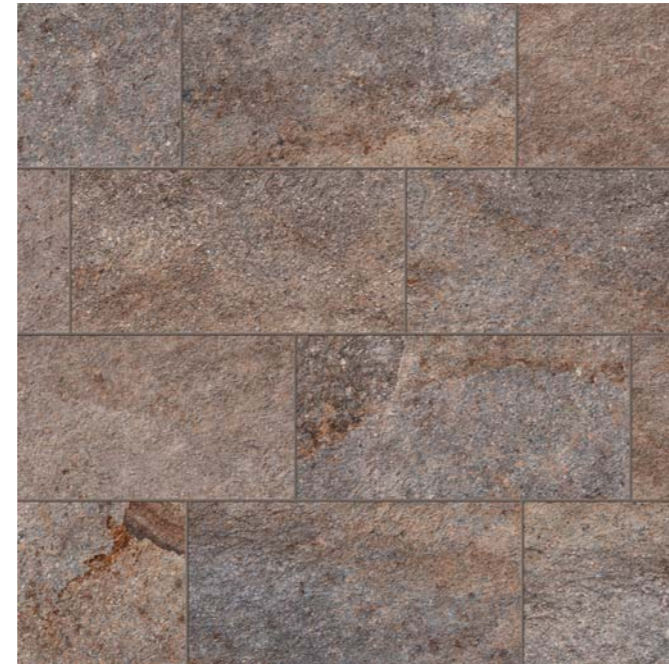
FORTH PORFIDO 22,5x45,3 .9"x18"