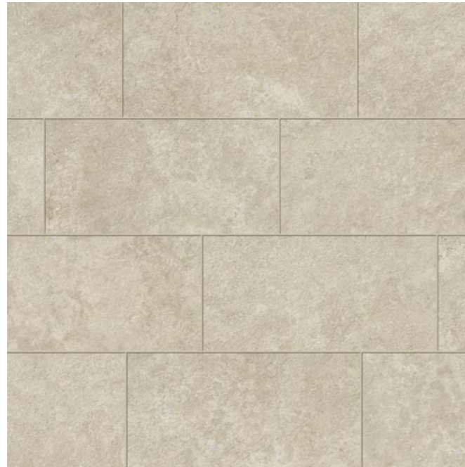
FORTH CHIANCA 22,5x45,3 .9"x18"