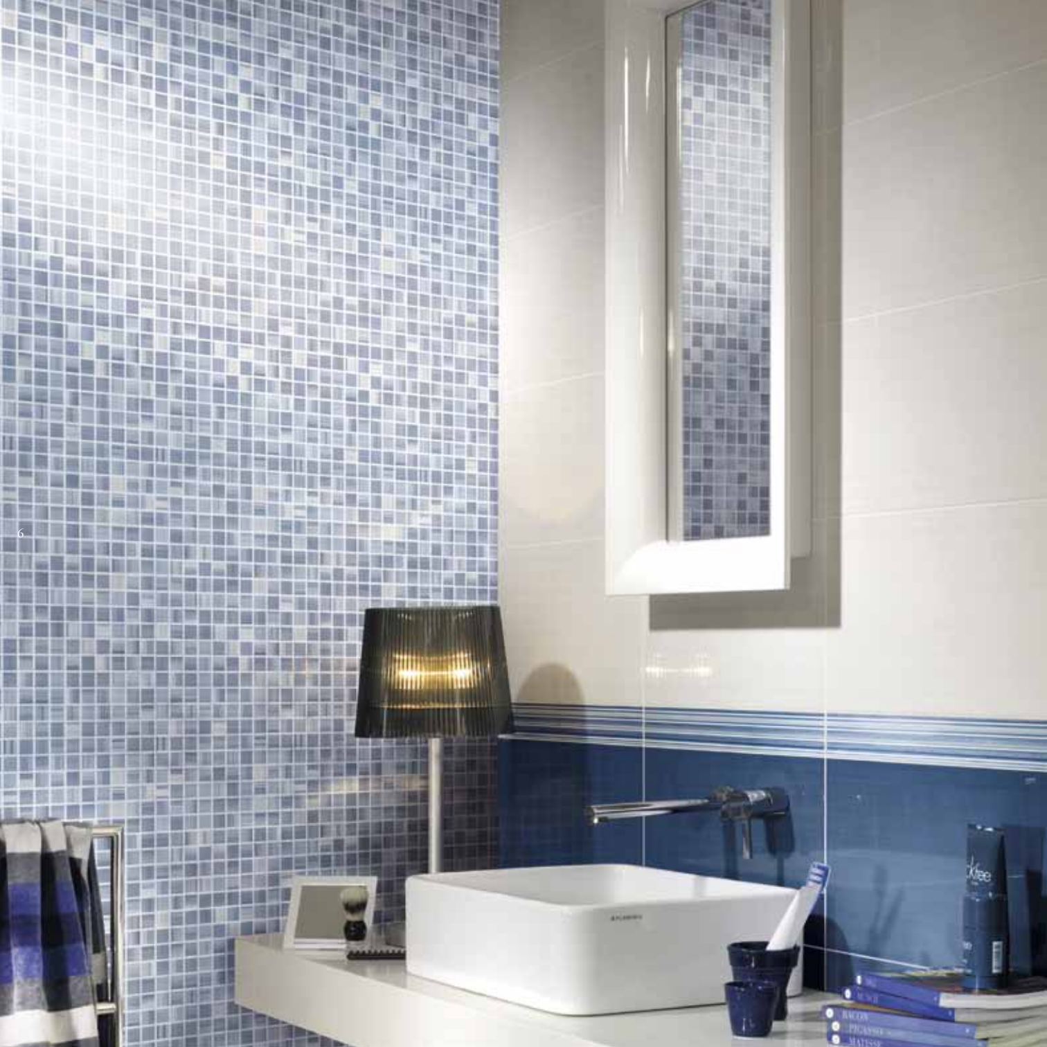
elisir blu elisir bianco Elisir Blu 25x45 - 10"x18" Elisir Bianco 25x45 - 10"x18" Elisir Blu/Azzurro mosaico 25x45 - 10"x18" Elisir Blu list. Righe 6x45 - 2,4"x18"