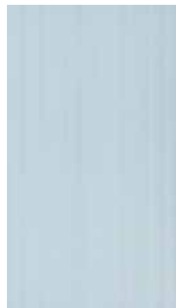
Elisir Azzurro 25x45 - 10"x18"