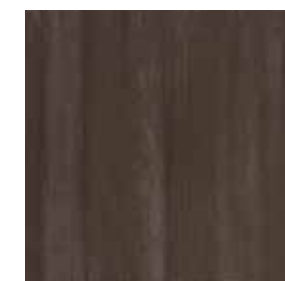
Marrone pav. 31,5x31,5 - 12"x12"

Pavimento coordinato in gres porcellanato Sol coordonné en grès cérame Kombinierte Bodenfliesen Feinsteinzeug Porcelain Stoneware matching floor Pavimentos coordinados en gres porcelánico Сочетающиеся керамогранитные полы