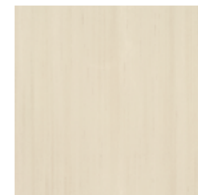
Beige pav. 31,5x31,5 - 12"x12"