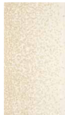
Elisir Beige decoro Astratto 25x45 - 10"x18"