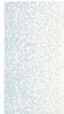
Elisir Bianco decoro Astratto 25x45 - 10"x18"