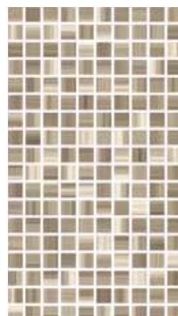
Elisir Marrone/Beige Mosaico 25x45 - 10"x18"