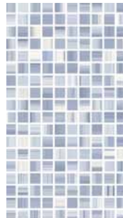
Elisir Blu/Azzurro Mosaico 25x45 - 10"x18"